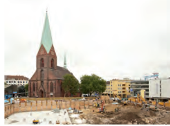
Kalender St. Nikolai 2012 für 10,-€ beim Küster erhältlich

Auch in diesem Jahr gibt es wieder einen Kalender mit Motiven von St. Nikolai. Das Besondere ist diesmal das wohl einzigartige Titelbild. So in ihrer ganzen Pracht werden wir die St. Nikolai-Kirche wohl nicht so schnell wieder sehen können. Ein Teil des Erlöses geht in die Sozialarbeit ein.