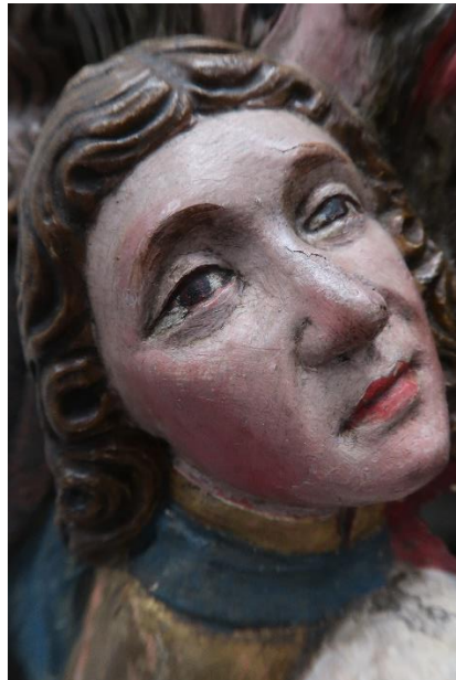
Himmelfahrt (nach der Restaurierung) Detail: Johannes vor und nach der Restaurierung